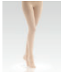
Strumpfhose mit Slipleibteil Tights with slip panty part