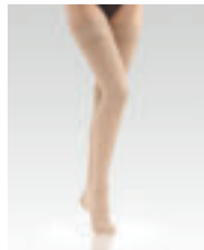
Halterlose mit Spitzenhaftband Stay-ups with lace grip top